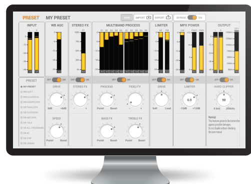
Interfaz del procesador de sonido