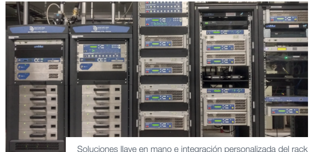
Soluciones llave en mano e integración personalizada del rack