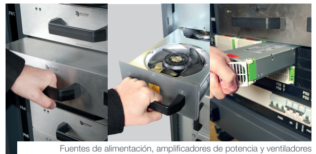
Fuentes de alimentación, amplificadores de potencia y ventiladores redundantes e intercambiables "en caliente"