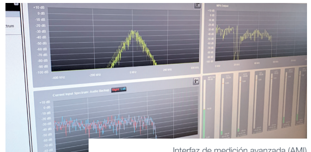
Interfaz de medición avanzada (AMI)