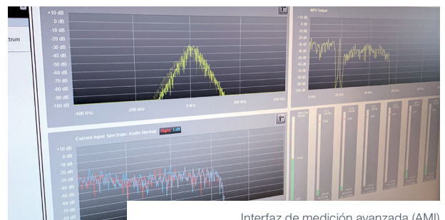
Interfaz de medición avanzada (AMI)