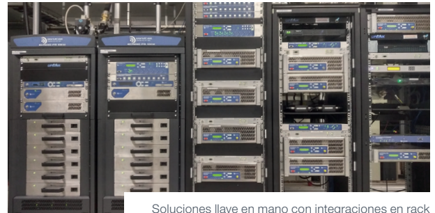
Soluciones llave en mano con integraciones en rack