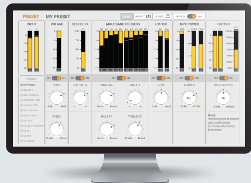
Interfaz de procesador de sonido