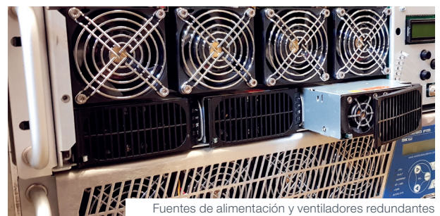
Fuentes de alimentación y ventiladores redundantes e intercambiables en caliente